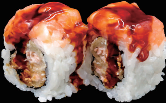
526 - URA. GOLDEN allergeni: 4