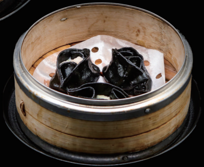
023 - DIM SUN CALAMARI