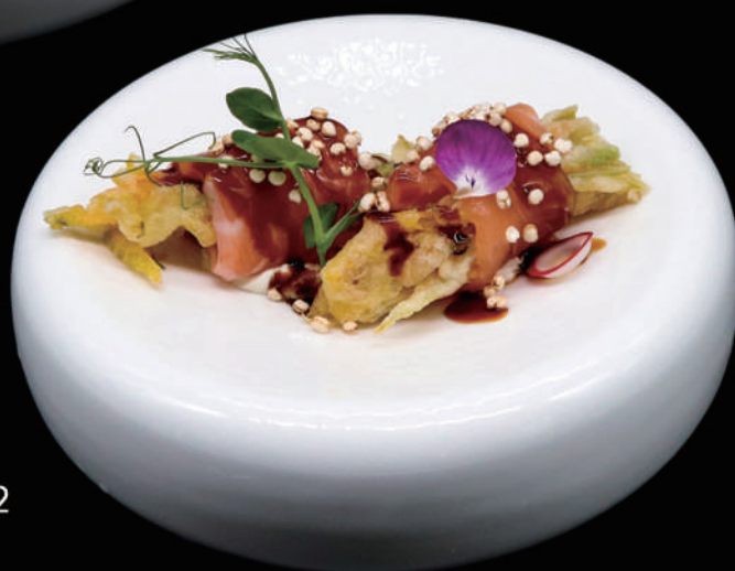
111 - FLOWER ROLL allergeni: 2