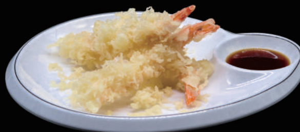
176 - EBI TEMPURA allergeni: 1, 2