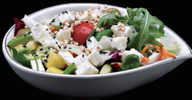
033 - BUFFALA SALADA