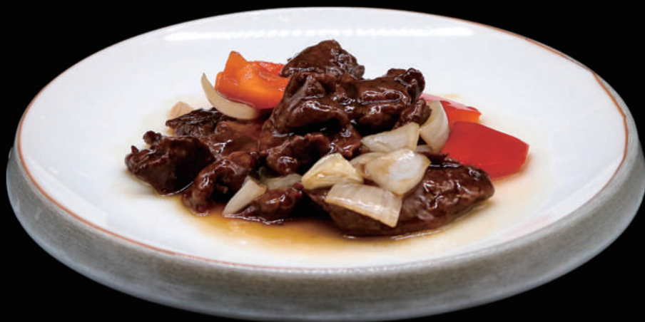
163 - MANZO AL PEPE NERO allergeni: 2