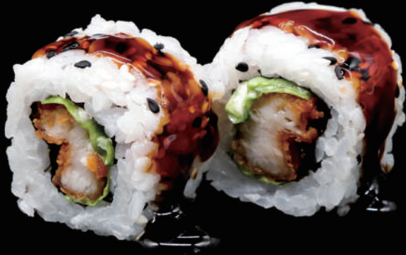
513 - URA. CHICKEN allergeni: 1, 11