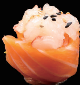
346 - GUNKAN ROSE allergeni: 1, 2, 4, 10