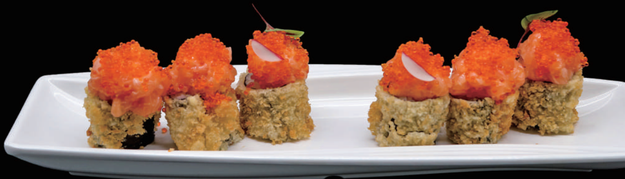
414 - FLY HOSO SPICY allergeni: 1, 4