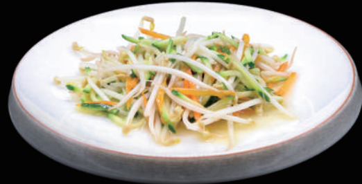
151 - VERDURE SALTATE