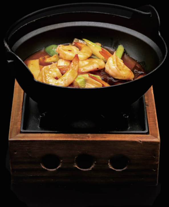
168 - KANCOO CON GAMBERI allergeni: 2, 9