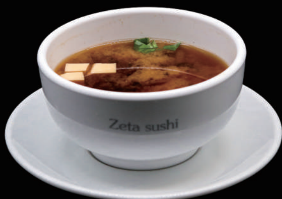
036 - MISO SHIRU