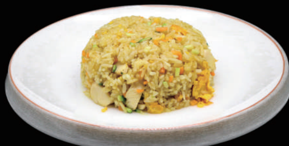
130 - RISO AL CURRY