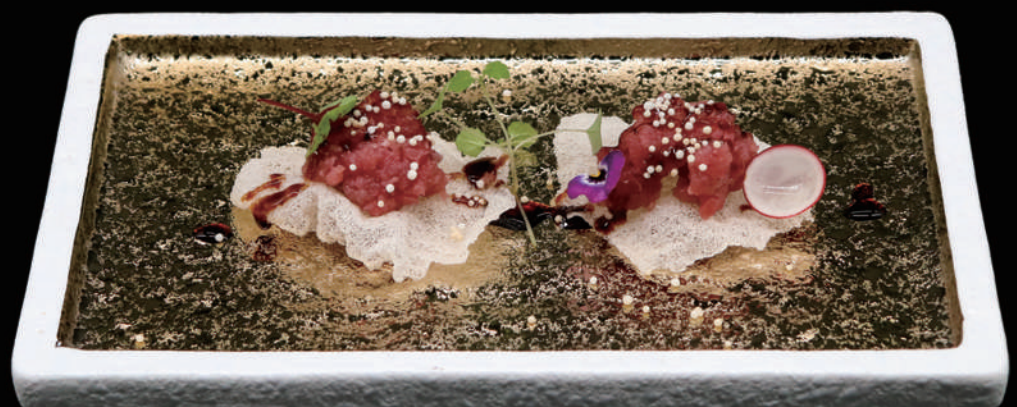
115 - CLOUD MAGURO allergeni: 1, 2, 4, 6, 7