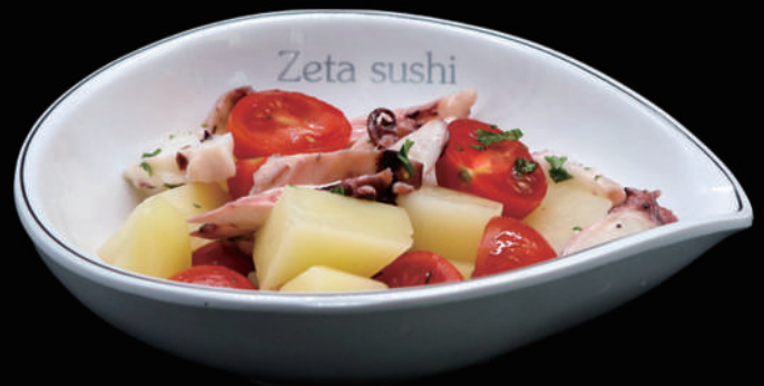
032 - POLPO PATATE allergeni: 4