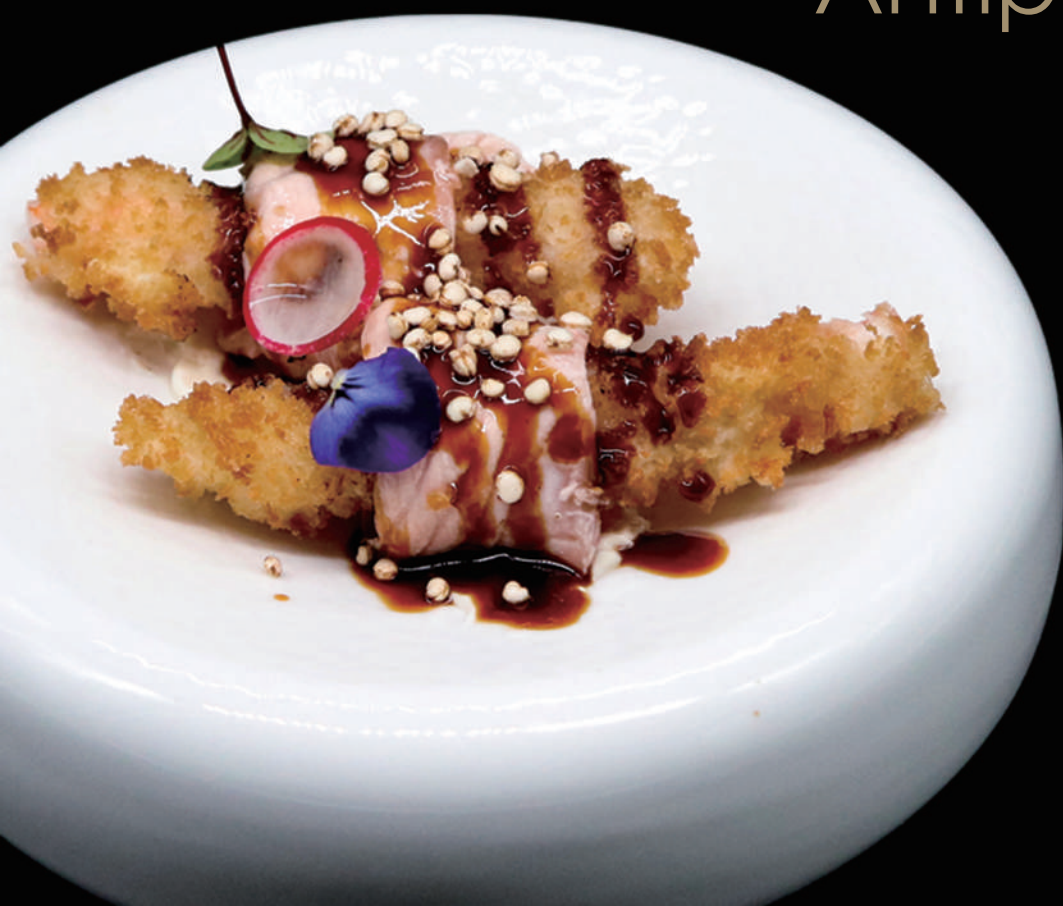
110 - EBI DIAMON ROLL allergeni: 2