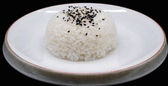
125 - GOHAN