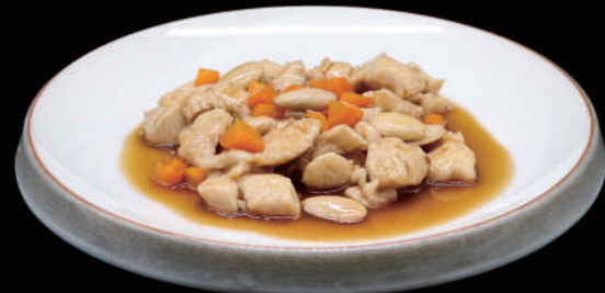
155 - POLLO MANDORLE