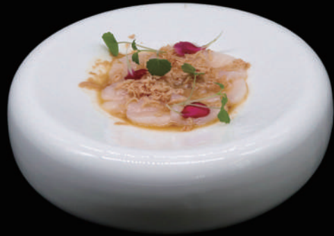
059 - CARPACCIO CAPESANTE allergeni: 2