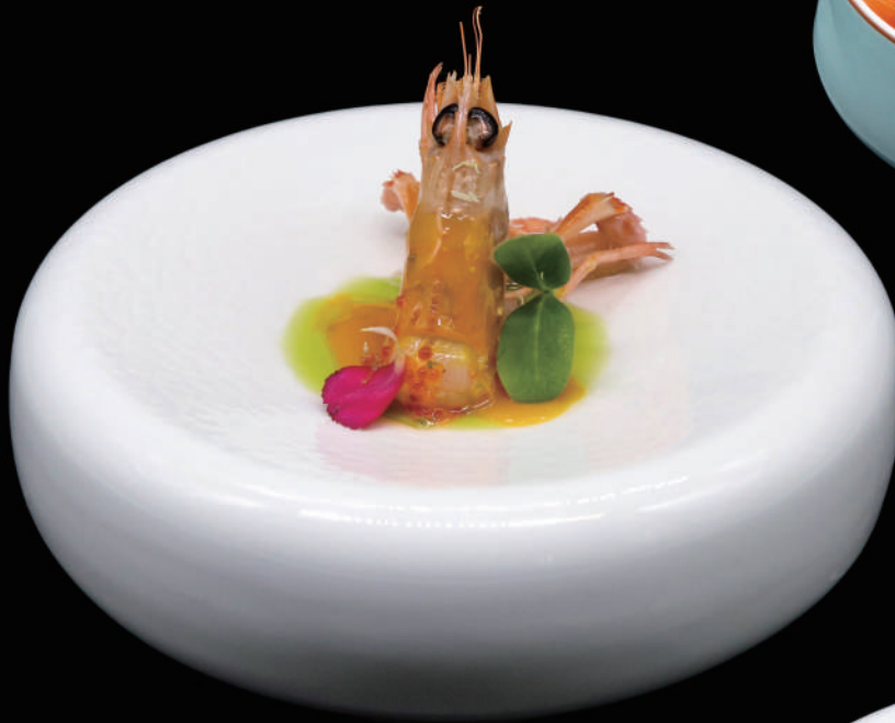
255 - SASHIMI SCAMPO allergeni: 2