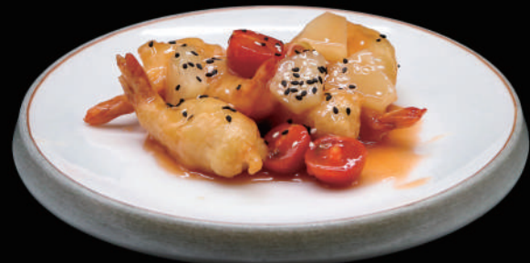
157 - GAMBERI AGRODOLCE allergeni: 2