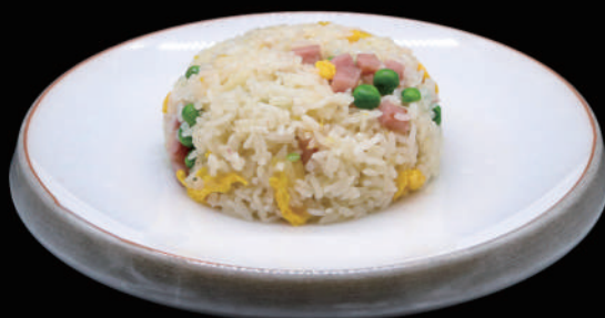
126 - RISO CANTONESE