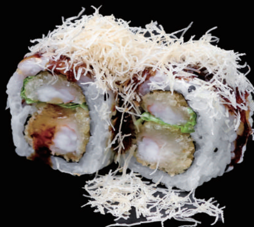
512 - URA. EBITEN allergeni: 1, 2, 11