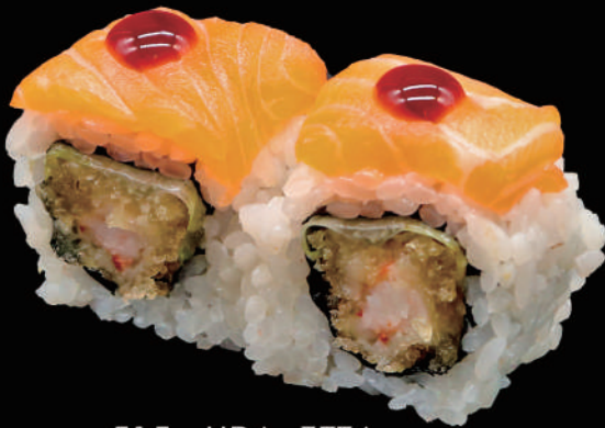
515 - URA. ZETA allergeni: 1, 2