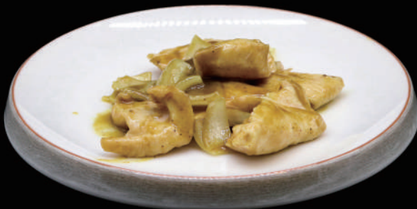
156 - POLLO AL CURRY