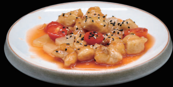
153 - POLLO AGRODOLCE