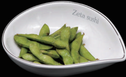
001 - EDAMAME allergeni: 6