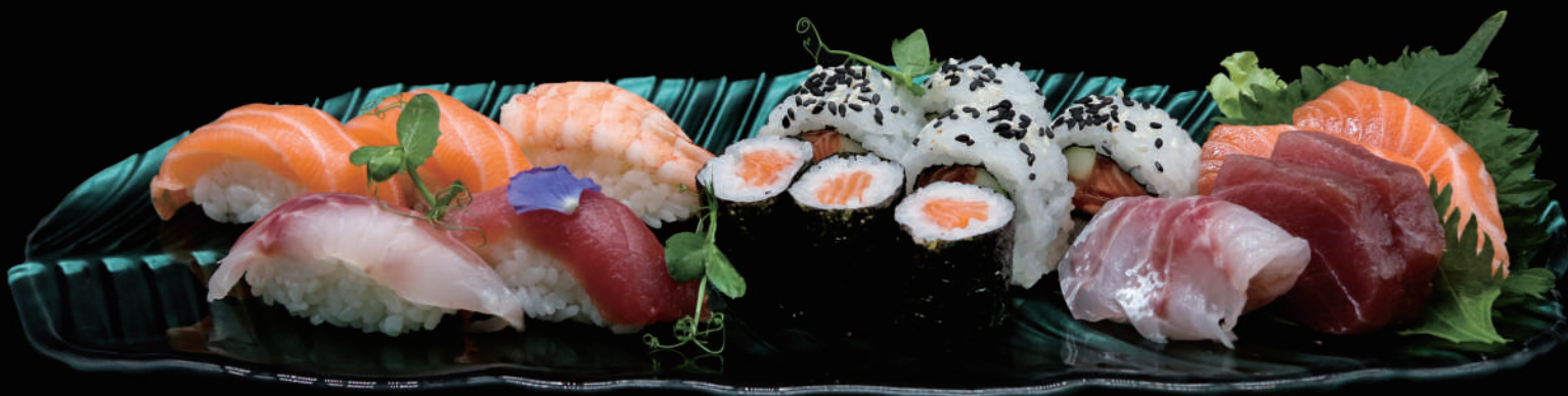
375 - SUSHI SASHIMI MIX 18PZ