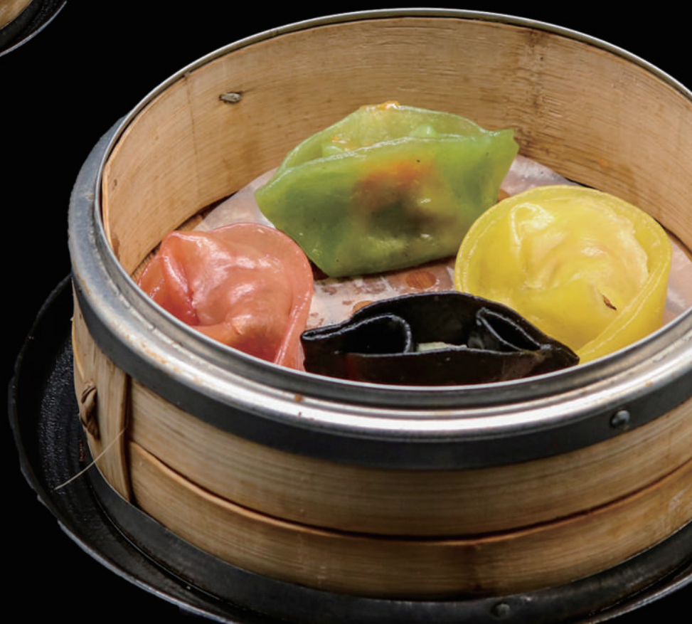
025 - DIM SUN MIX