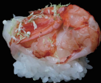
306 - N. AMAEBI