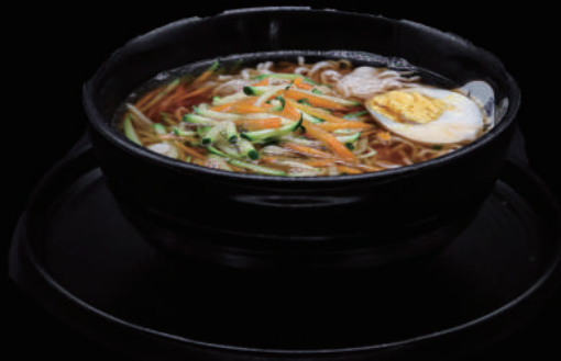
144 - RAMEN VERDURE