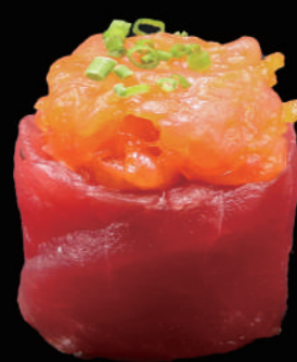
342 - GUNKAN TONNO allergeni: 4