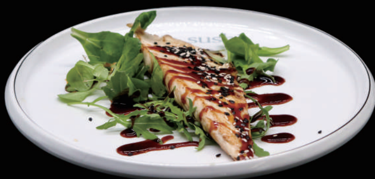
193 - SUZUKI TEPPANYAKI allergeni: 4