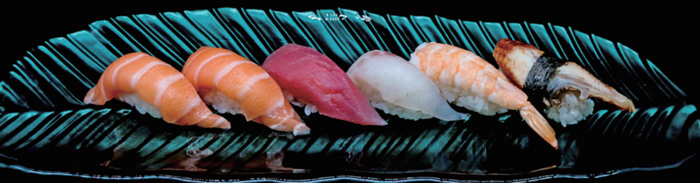
371 - NIGIRI MIX 6PZ