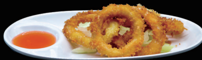
183 - CALAMARO FRITTO allergeni: 1, 4