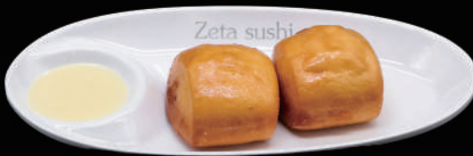
013 - PANE FRITTO allergeni: 1