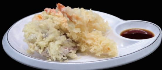
177 - MORIAWASE TEMPURA allergeni: 1, 2