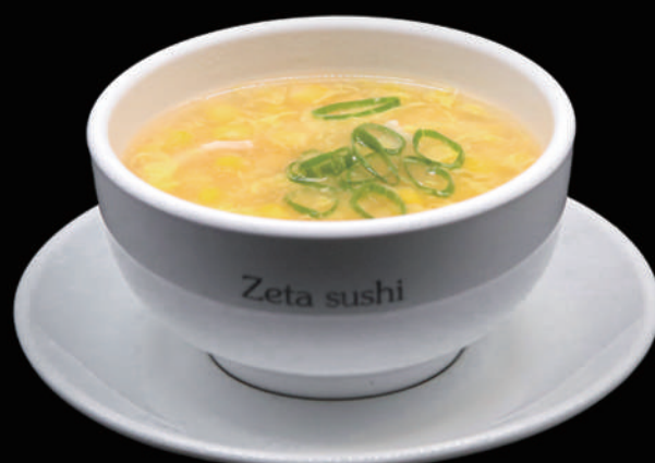
037 - ZUPPA DI POLLO E MAIS