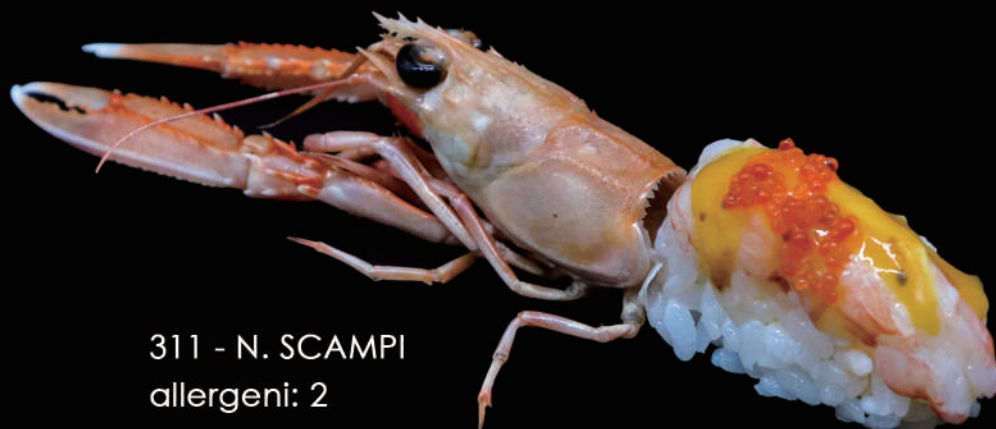
311 - N. SCAMPI allergeni: 2