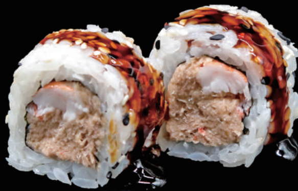
508 - URA. PACIFIC allergeni: 1, 4, 6, 11