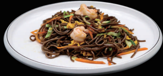
143 - SOBA GAMBERI allergeni: 2