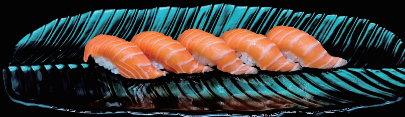
370 - SAKE PLUS 5PZ