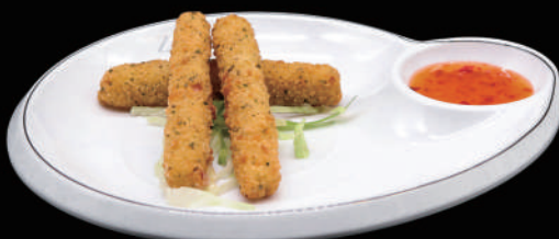
007 - MOZARELLA STICK allergeni: 1