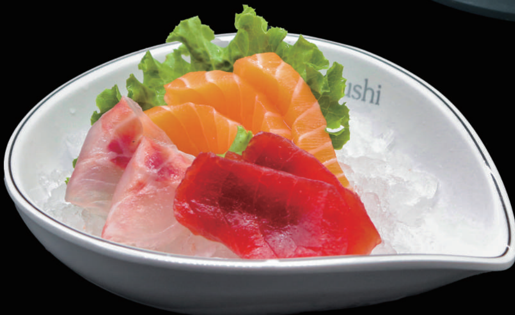
253 - SASHIMI MIX allergeni: 4