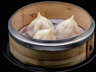
014 - BAOZI