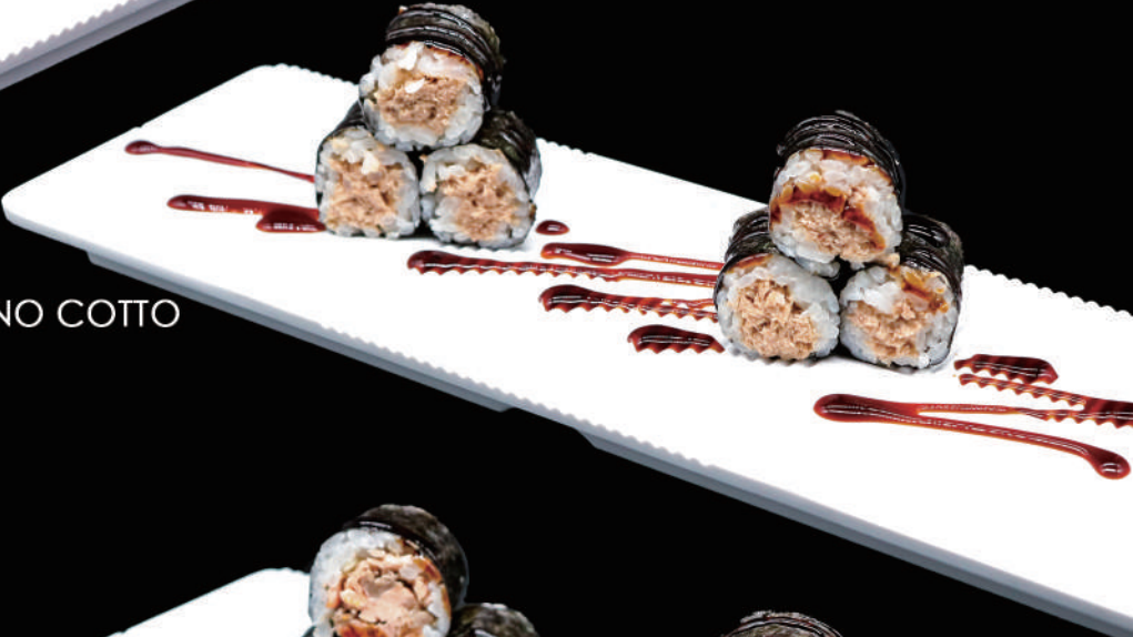
408 - HOSO TONNO COTTO allergeni: 4