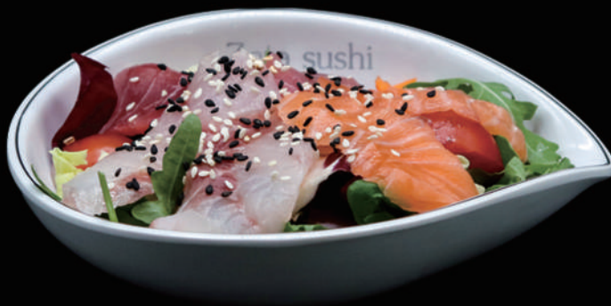
031 - SASHIMI SALADA allergeni: 4