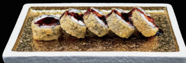
472 - FUTO FRITTO allergeni: 4