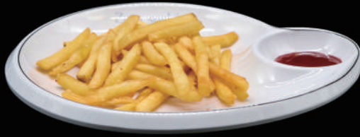
009 - PATATE FRITTE allergeni: 1