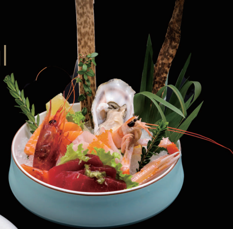
254 - SASHIMI SPECIALE allergeni: 2, 4