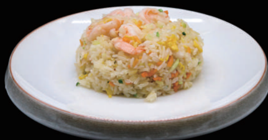
128 - RISO GAMBERI allergeni: 4