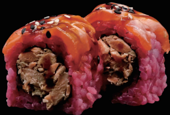
562 - ROSE MIURA PLUS