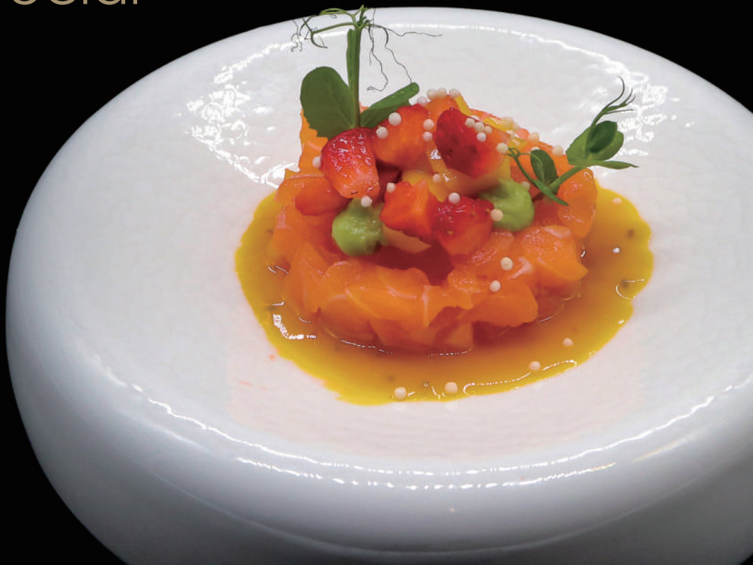
071 - ESOTIC TARTARE allergeni: 4