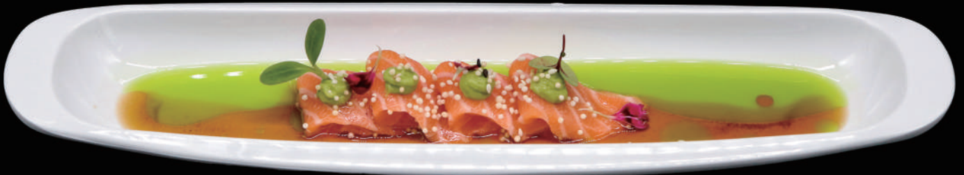
057 - CARPACCIO SALMONE allergeni: 4, 6, 11