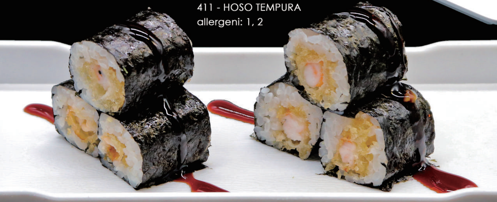
411 - HOSO TEMPURA allergeni: 1, 2