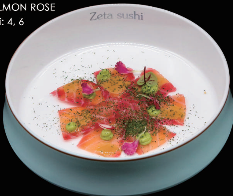
051 - SALMON ROSE allergeni: 4, 6