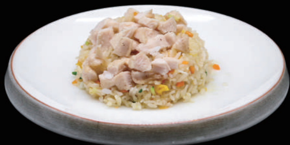
129 - RISO POLLO