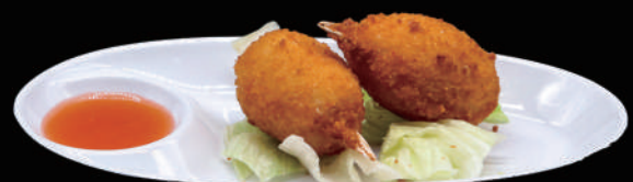
008 - CHELE DI GRANCHIO allergeni: 1