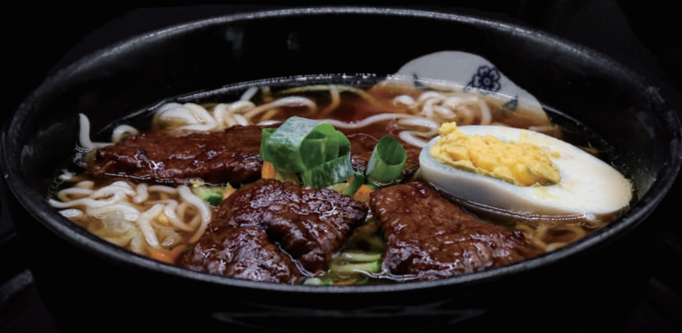
146 - RAMEN MANZO allergeni: 4