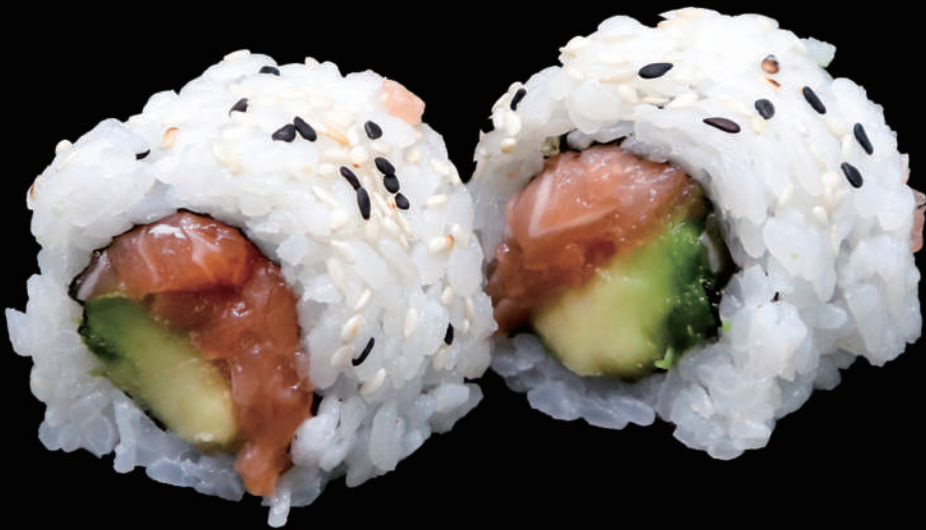
501 - URA. SAKE allergeni: 4, 11