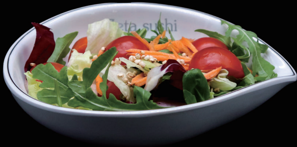
030 - YASAI SALADA