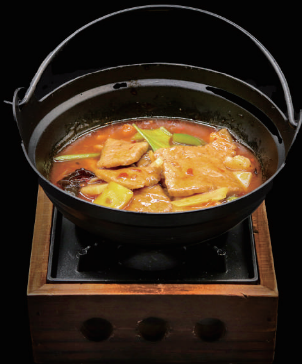
169 - KANCOO CON MANZO allergeni: 9