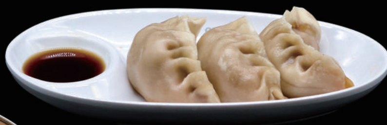
018 - GYOZA