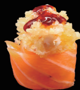
348 - GUNKAN TEMPURA allergeni: 1, 4