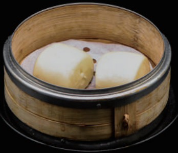
011 - PANE ORIENTALE