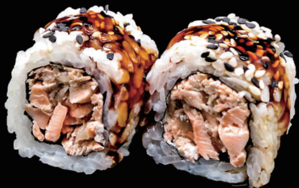
507 - URA. MIURA allergeni: 1, 4, 6, 7, 11