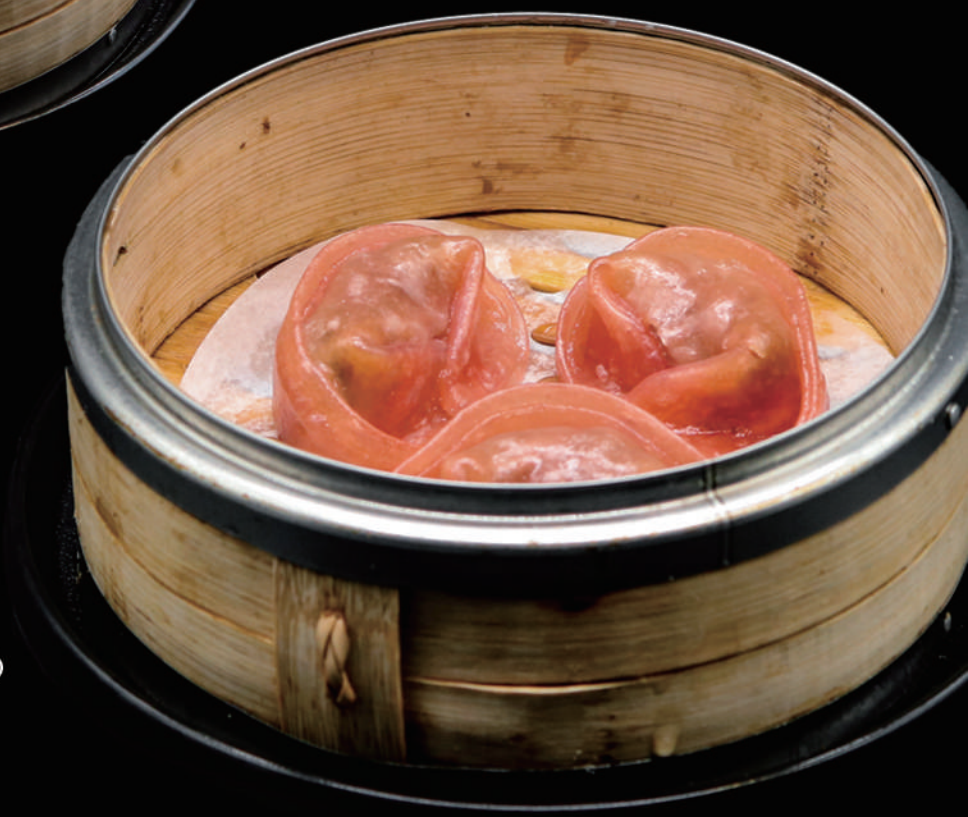
021 - DIM SUN MANZO