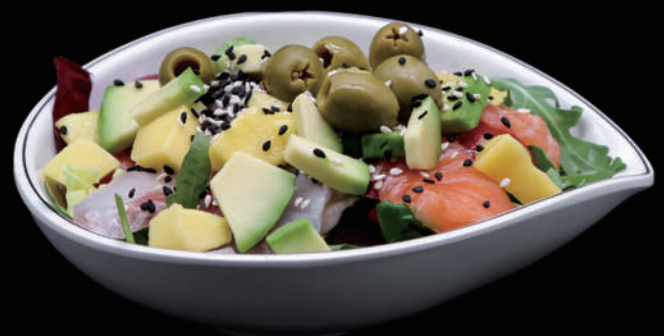
034 - ZETA SALADA allergeni: 4