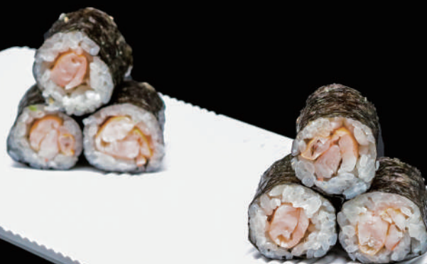
406 - HOSO EBI allergeni: 2