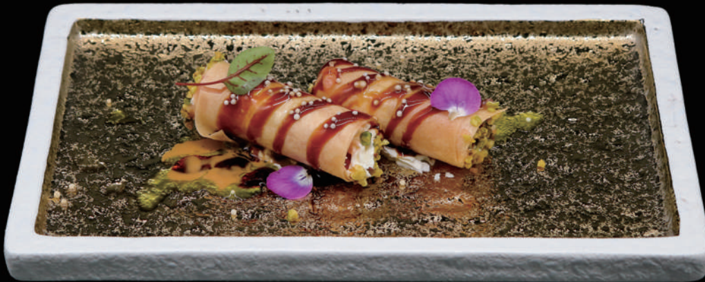
112 - CANNOLO SAKE allergeni: 1, 4, 7, 8, 10, 11