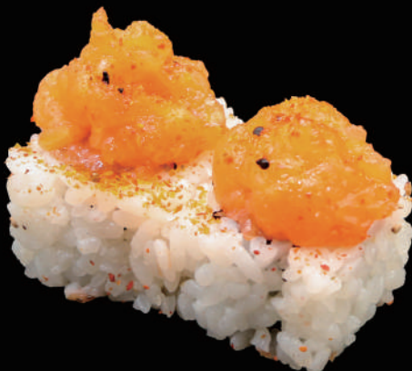
505 - URA. SPICY SALMON allergeni: 1, 4, 11