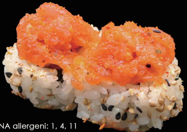
506 - URA. SPICY TUNA allergeni: 1, 4, 11