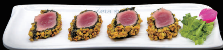
200 - MAGURO TATAKI SPECIAL