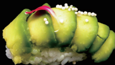
309 - N. AVOCADO