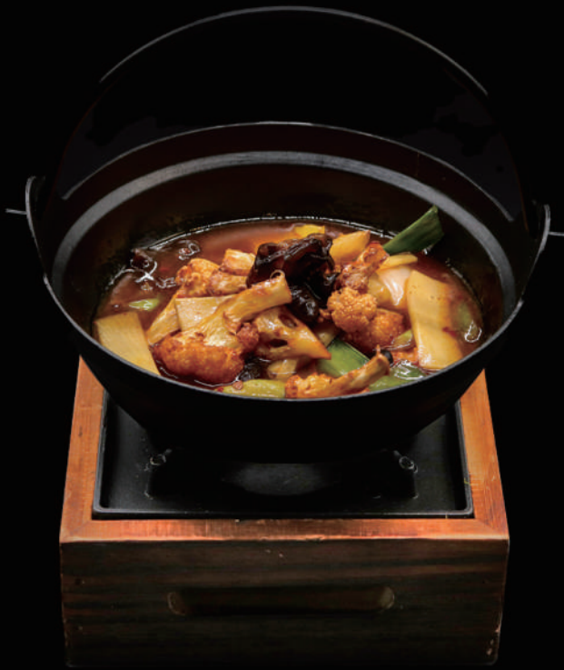
167 - KANCOO CON CAVOLFIORE allergeni: 9