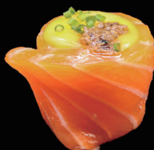
347 - GUNKAN EGG allergeni: 3, 4