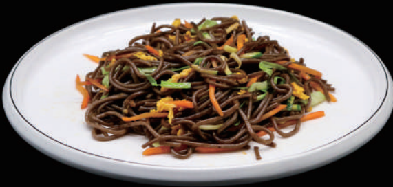
142 - SOBA VERDURE