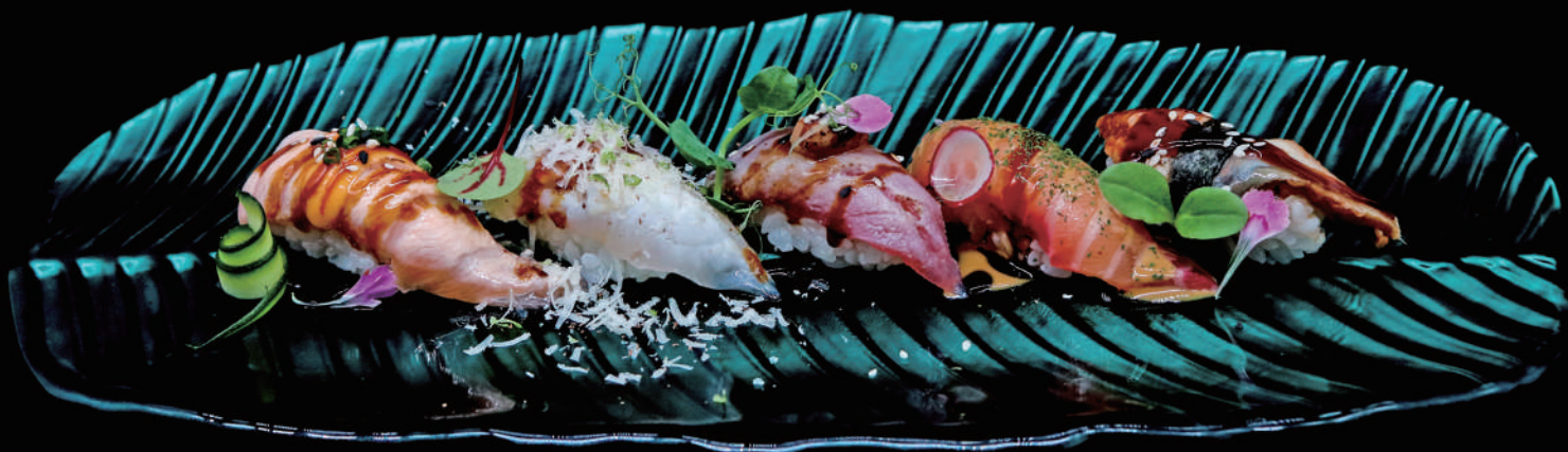
373 - N. MIX SPECIAL