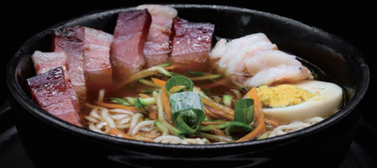
145 - ZETA RAMEN allergeni: 2