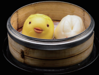
012 - PANE DOLCE