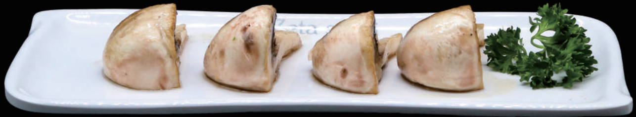
187 - FUNGHI ALLA PIASTRA allergeni: 2