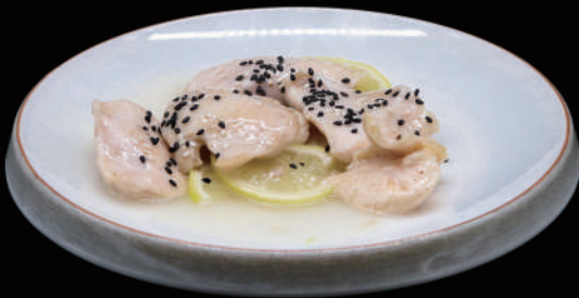
152 - POLLO AL LIMONE