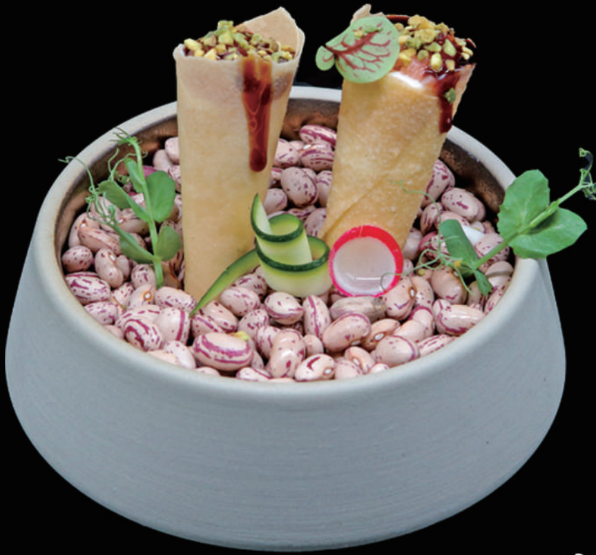
118 - CONO SAKE allergeni: 1, 4, 6, 7