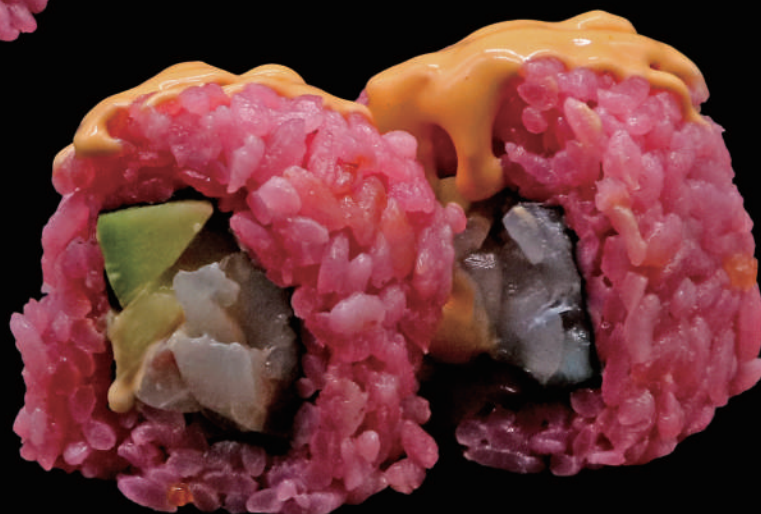
564 - ROSE WHITE allergeni: 4