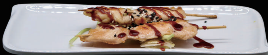
190 - YAKITORI