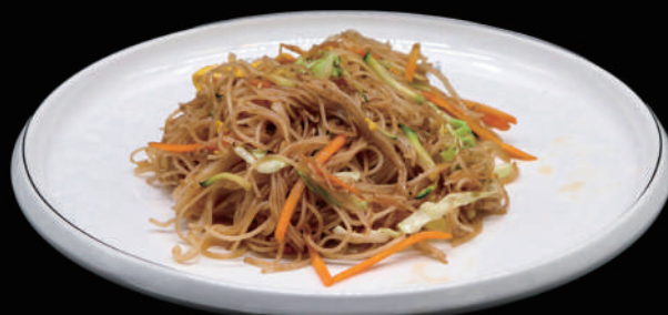
132 - SPAGHETTI DI RISO CON VERDURE