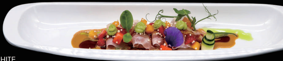
054 - CEVICHE WHITE allergeni: 1, 4, 5, 6, 10