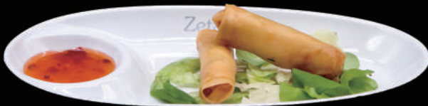
003 - HARUMAKI allergeni: 1