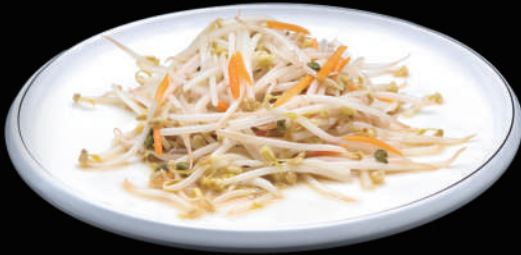
150 - GERMOGLI DI SOIA