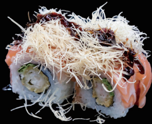
516 - URA. TIGER allergeni: 1, 2, 4