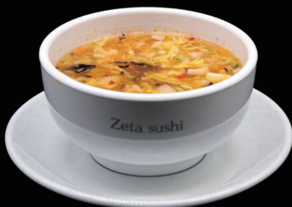
038 - ZUPPA AGROPICCANTE