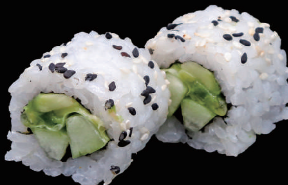
510 - URA. GREEN