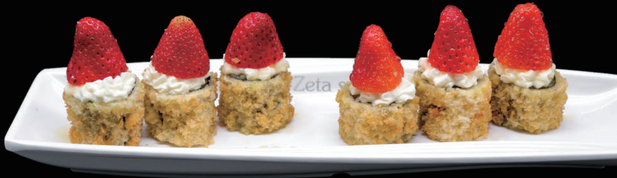
412 - FLY HOSO STRAWBERRY allergeni: 1, 6, 7