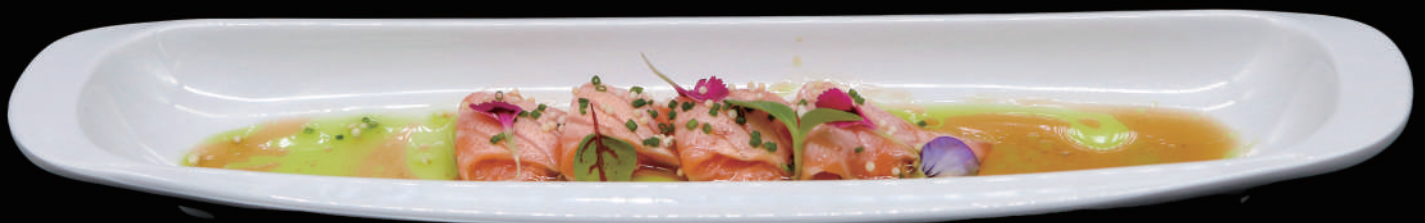
060 - CARPACCIO FLAMBE S allergeni: 4