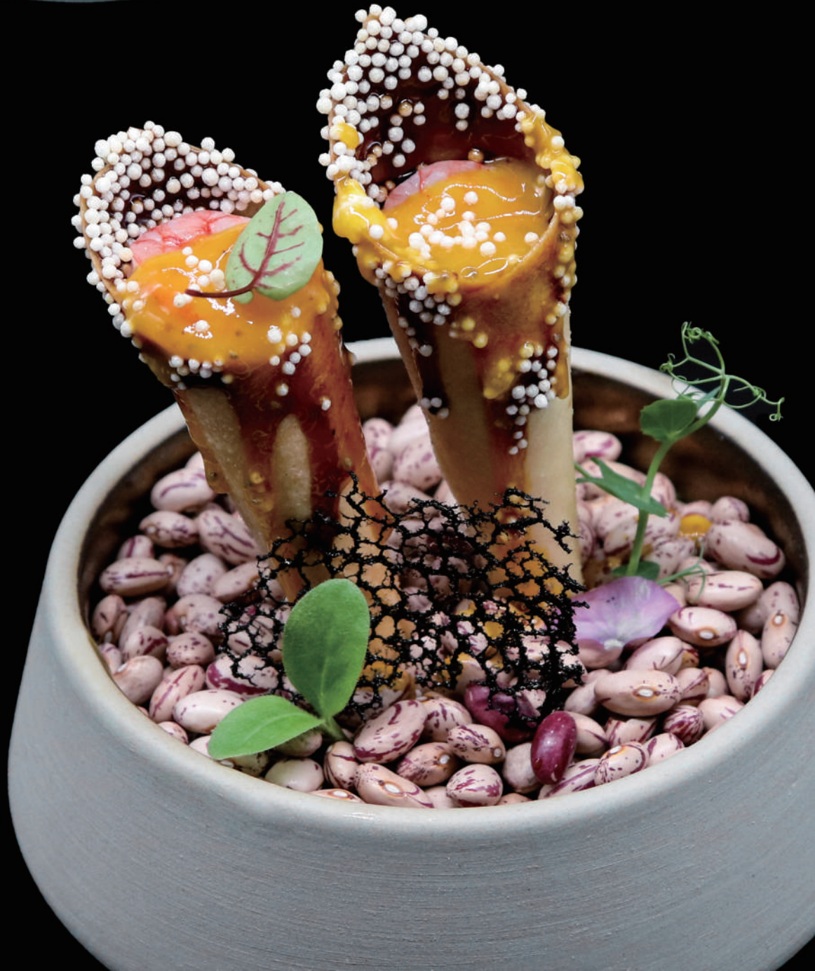
120 - CONO AMAEBI allergeni: 1, 2