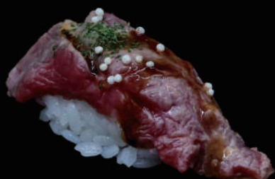
310 - N. BEEF allergeni: 2