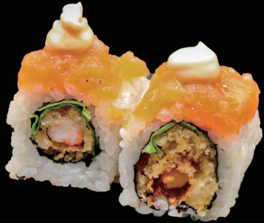
525 - URA. SPICY SALMON PLUS allergeni: 1, 2, 3, 4, 6