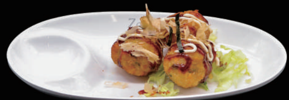
016 - TAKOYAKI allergeni: 1