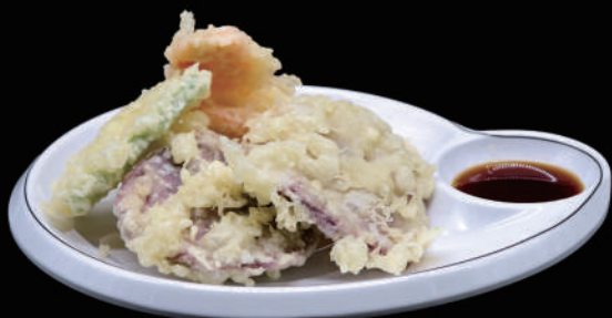
175 - YASAI TEMPURA allergeni: 1