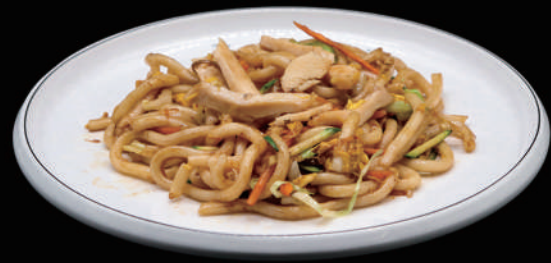
141 - UDON POLLO