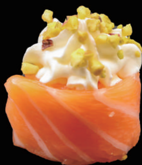
341 - GUNKAN PHILA allergeni: 4, 7