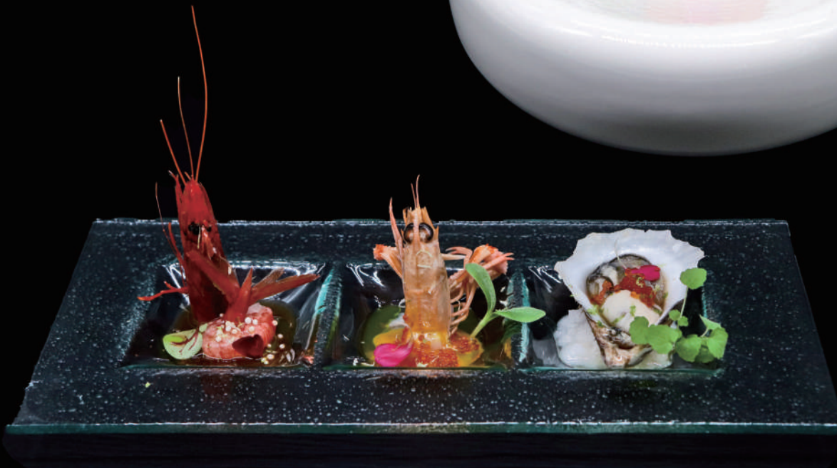
258 - SASHIMI CROSTACEI