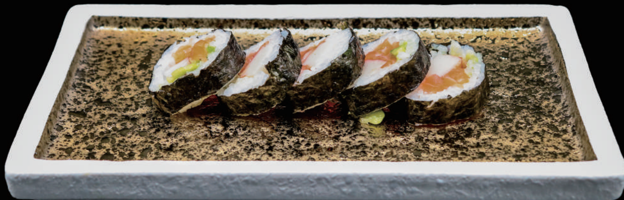
470 - FUTO CALIFORNIA allergeni: 4