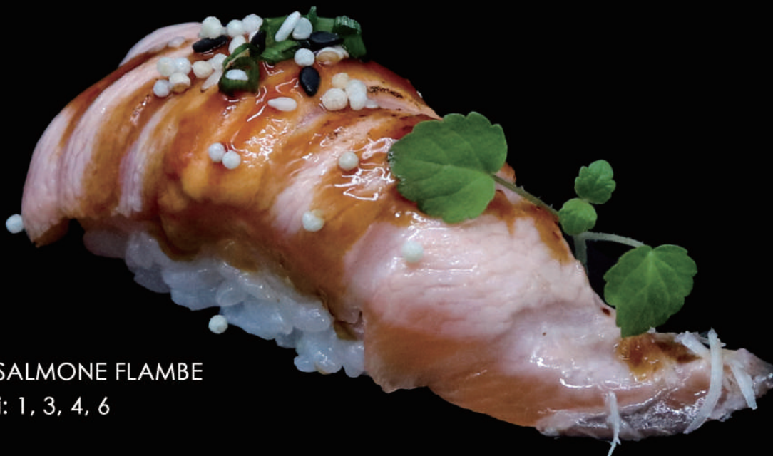
313 - N. SALMONE FLAMBE allergeni: 1, 3, 4, 6