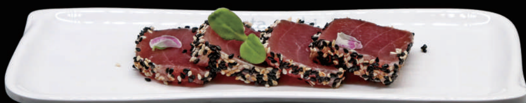
196 - MAGURO TATAKI allergeni: 4