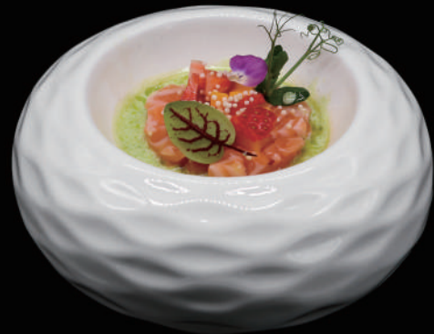
067 - TARTARE GOURMET allergeni: 1, 4, 6, 7