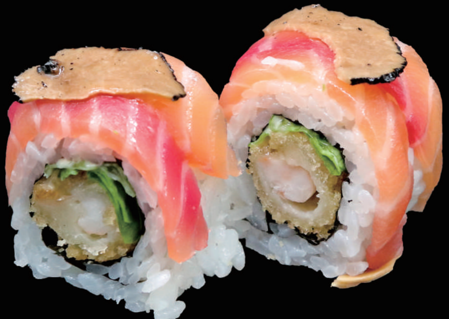
528 - URA. EBI FUME allergeni: 4, 6