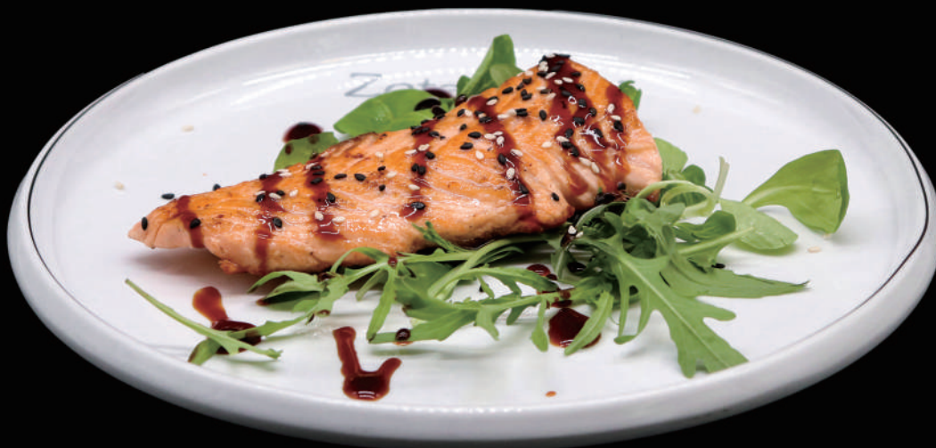
192 - SAKE TEPPANYAKI allergeni: 4