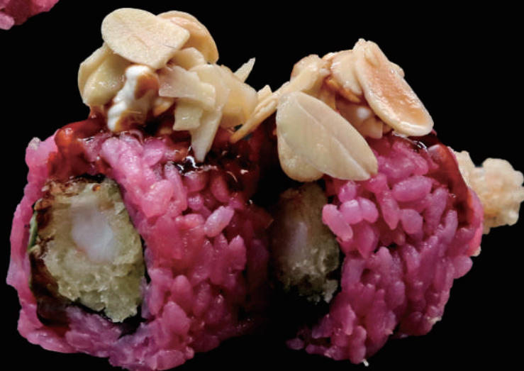
561 - ROSE TEMPURA allergeni: 2, 6