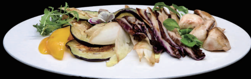
189 - VERDURE MISTE ALLA PIASTRA allergeni: 2