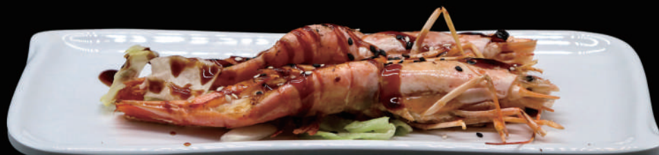
194 - EBI TEPPANYAKI allergeni: 2