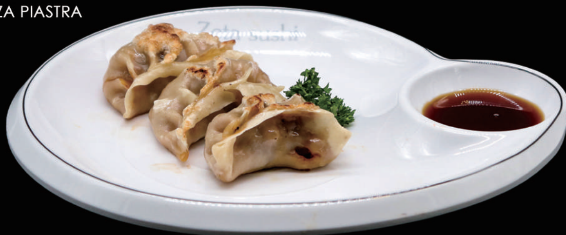
019 - GYOZA PIASTRA