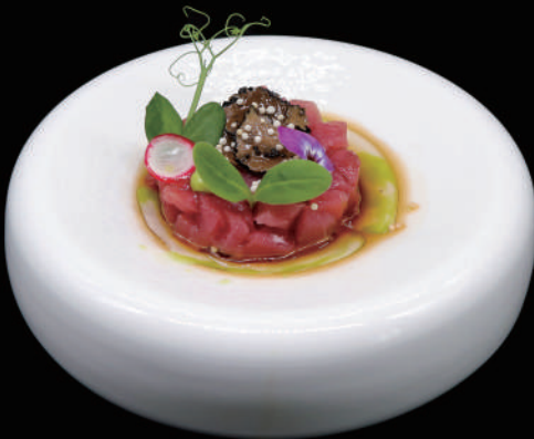
065 - TARTARE TUNA TRUFFLE allergeni: 4, 6