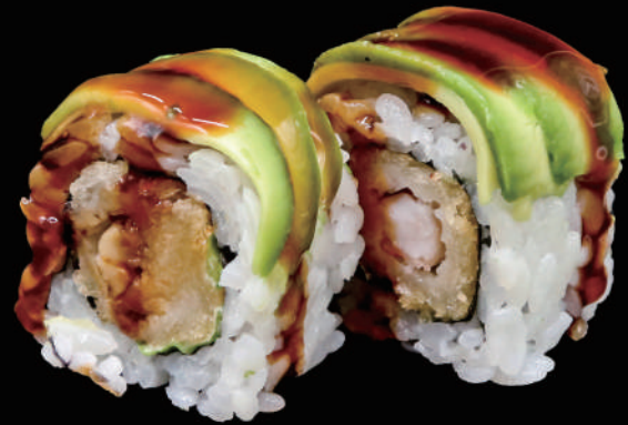
527 - URA. DRAGON allergeni: 1, 2, 3, 4, 6, 11