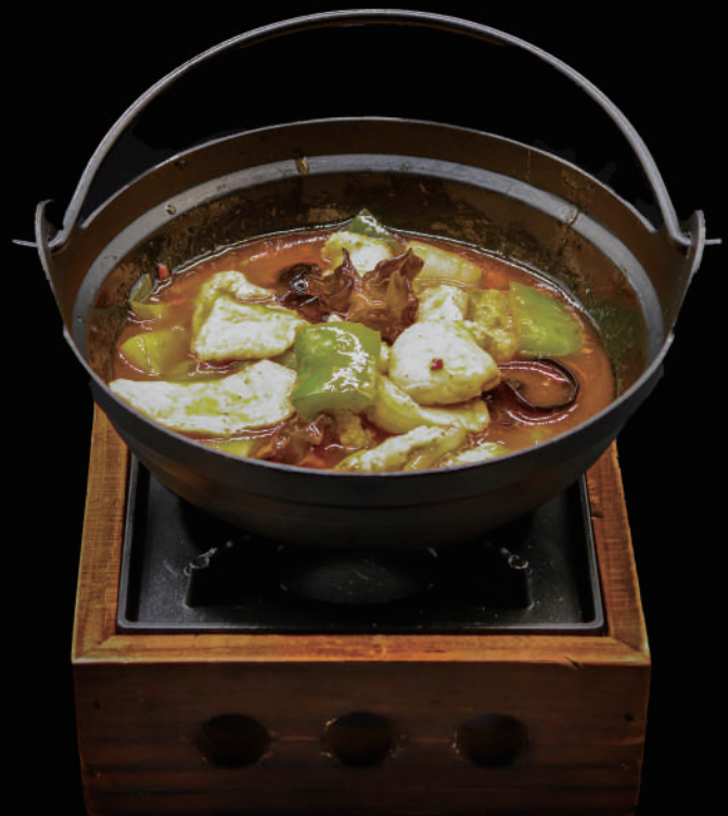
170 - KANCOO POLLO allergeni: 9