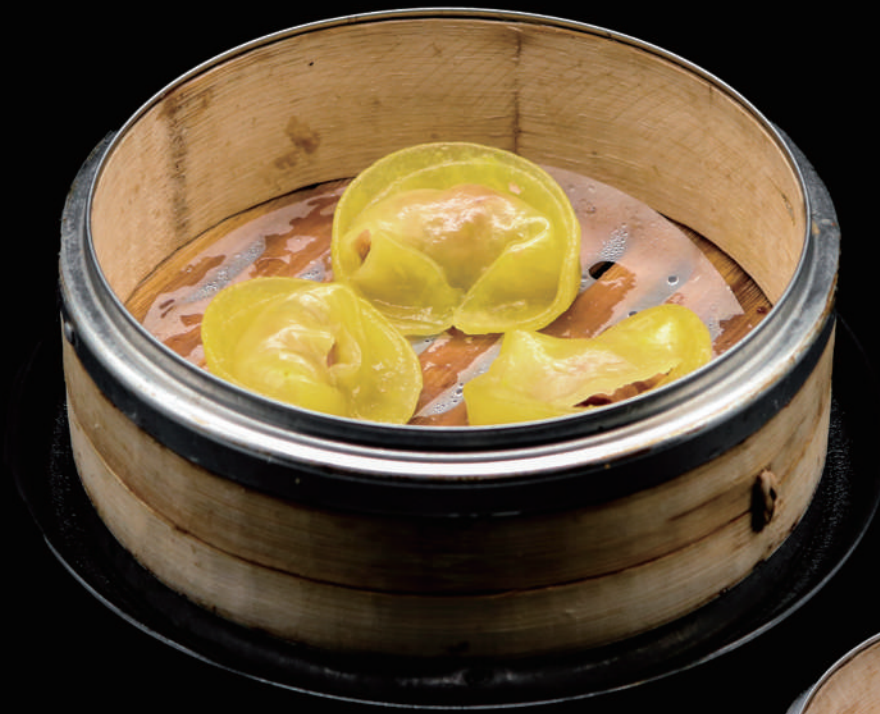
022 - DIM SUN TOTANO