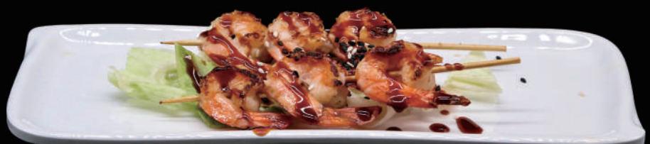
191 - YAKI EBI allergeni: 2