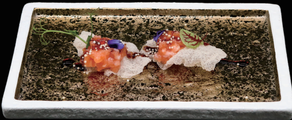
114 - CLOUD SAKE allergeni: 1, 2, 4, 6, 7