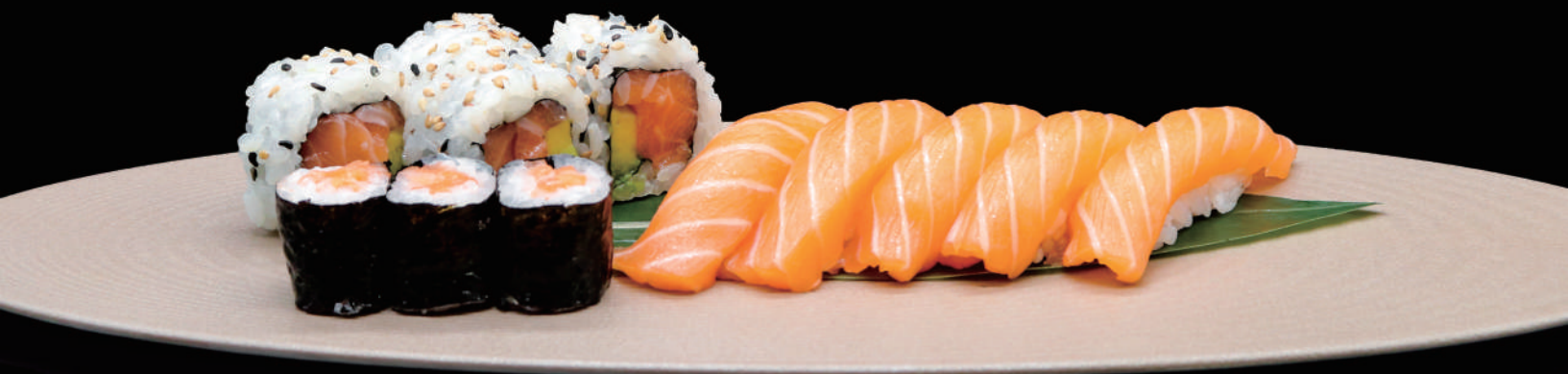
374 - SMALL SUSHI MAKI MIX 12PZ