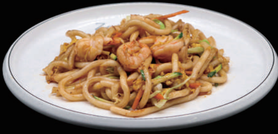
140 - UDON GAMBERI allergeni: 2