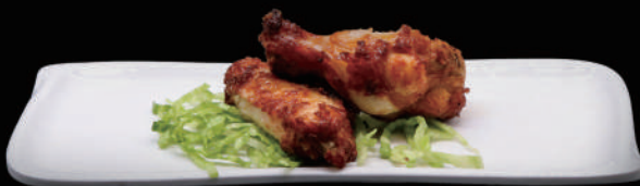
005 - ALETTE DI POLLO allergeni: 1