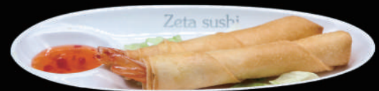
004 - EBI STICK allergeni: 1