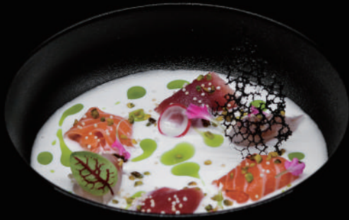
056 - CARPACCIO GOURMET allergeni: 1, 4, 8