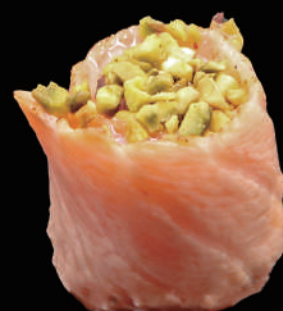
345 - GUNKAN FLAMBE allergeni: 1, 4, 8