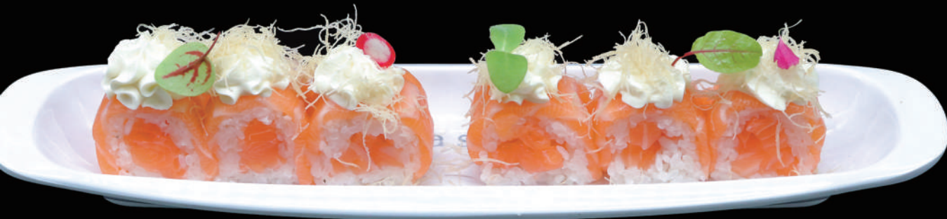
517 - URA. SALMON FRESH allergeni: 4, 7