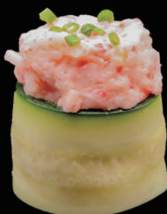
344 - GUNKAN GAMBERI COTTI allergeni: 1, 2, 3, 4