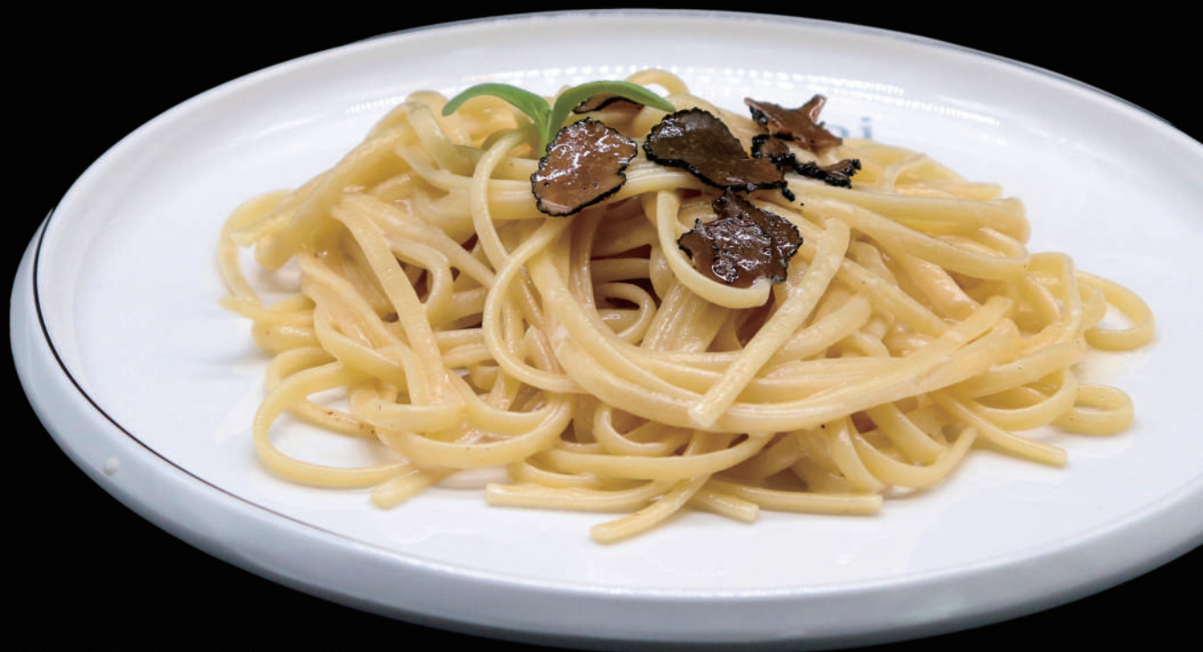
122 - TAGLIATELLE AL TARTUFO allergeni: 7