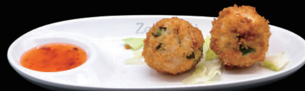
179 - EBI KAROKKE allergeni: 1, 2