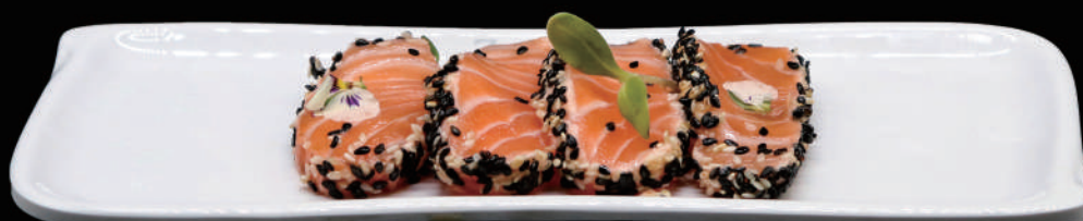
195 - SAKE TATAKI allergeni: 4