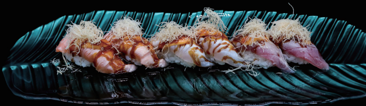
372 - NIGIRI FLAMBE MIX 6PZ