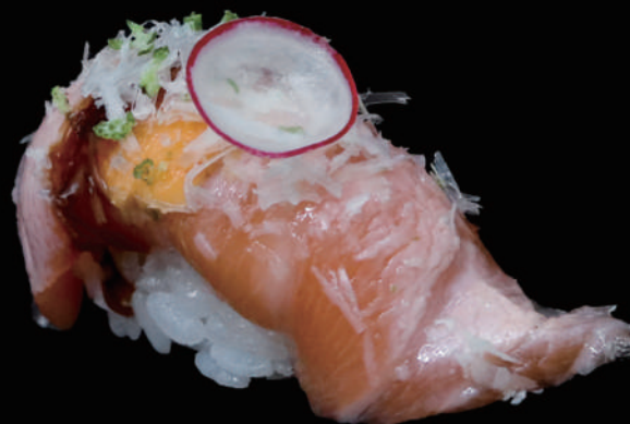
316 - N. SALMON CHEESE allergeni: 1, 3, 4, 6, 7