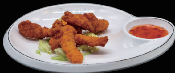
184 - POLLO FRITTO allergeni: 1