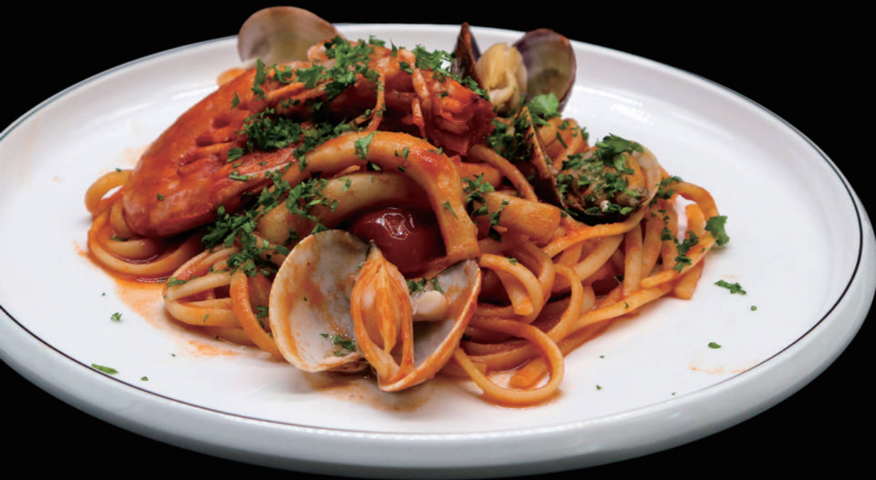
121 - SPAGHETTI AI FRUTTI DI MARE allergeni: 7