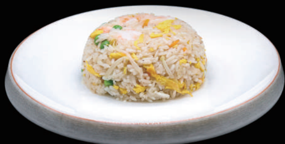
131 - ZETA DON allergeni: 2