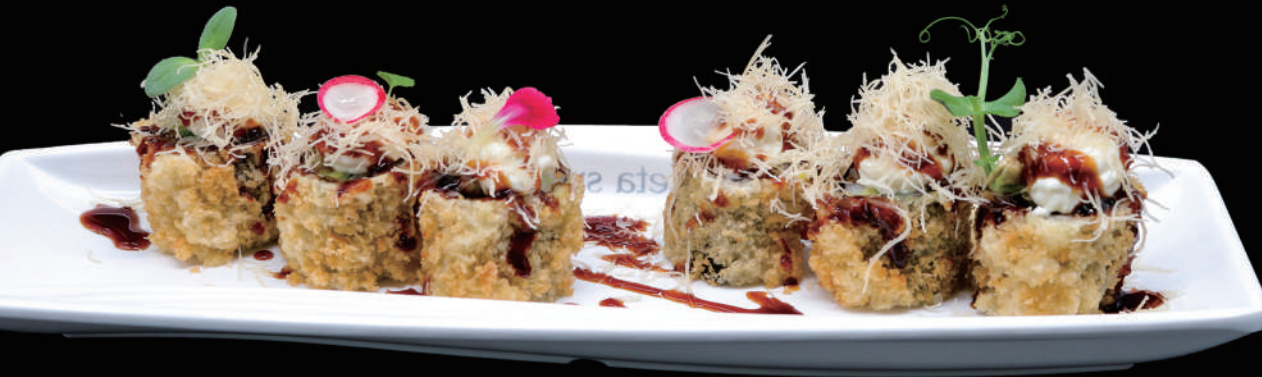
413 - FLY HOSO allergeni: 1, 6, 7