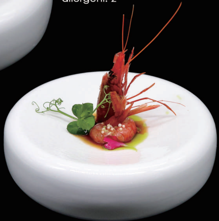
257 - SASHIMI GAMBERI ROSSO