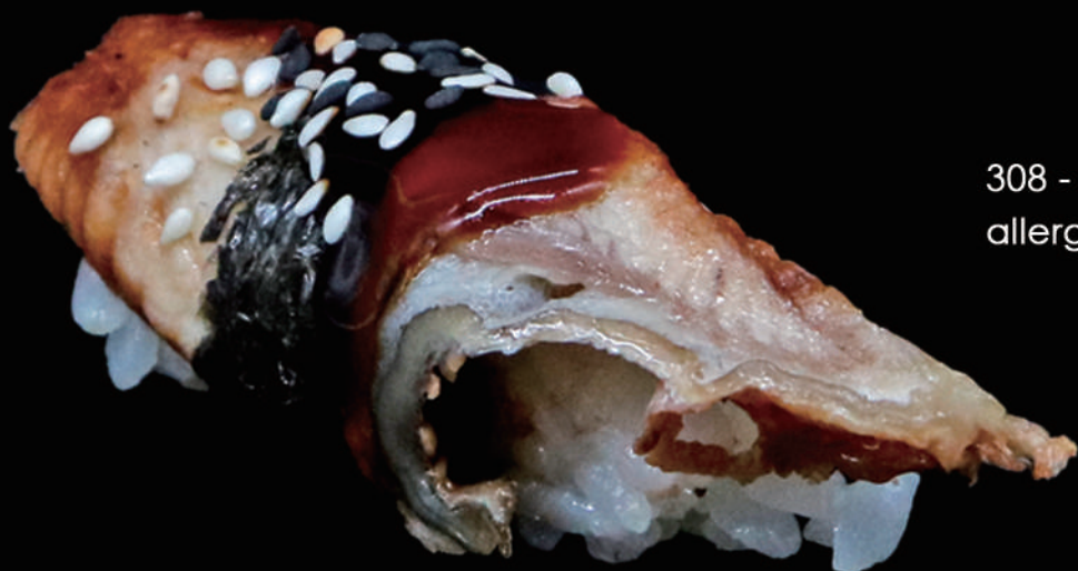
308 - N. ANGUILLA allergeni: 1, 4, 6