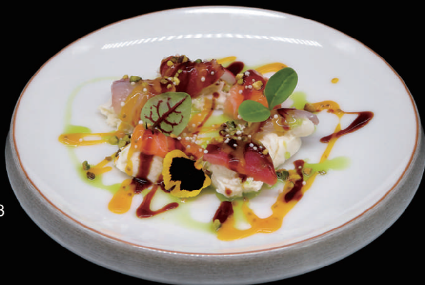
053 - MIX BUFALA allergeni: 1, 4, 6, 7, 8