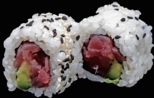
503 - URA. MAGURO allergeni: 4, 11