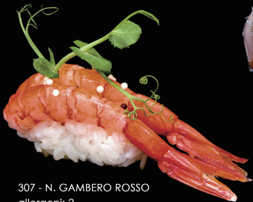
307 - N. GAMBERO ROSSO allergeni: 2