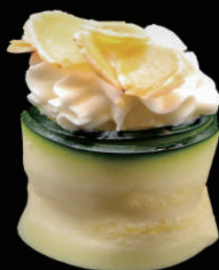
343 - GUNKAN ZUCCHINA allergeni: 1, 4, 6, 7