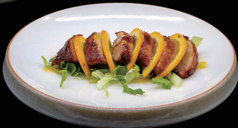
166 - ANATRA ALL ARANCIA allergeni: 2