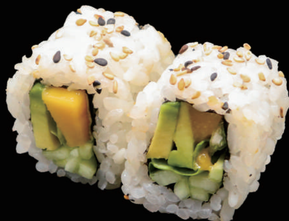
511 - URA. YASAI MANGO allergeni: 1, 10, 11