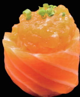
340 - GUNKAN SALMONE allergeni: 4