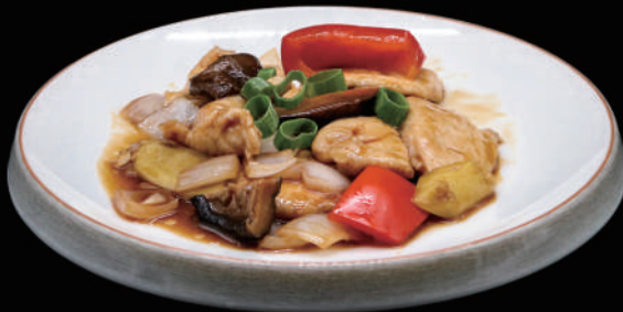
154 - POLLO ALLO ZENZERO