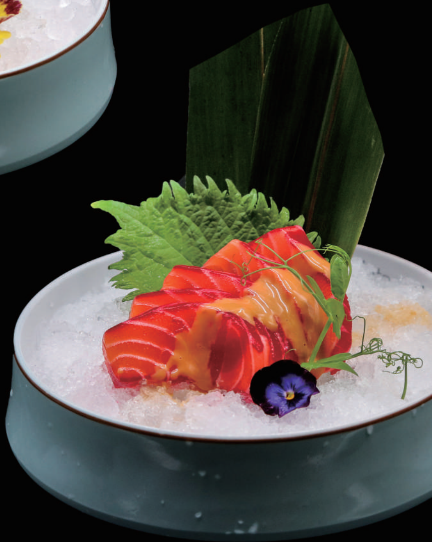
252 - SASHIMI SAKE SPECIAL allergeni: 1, 4