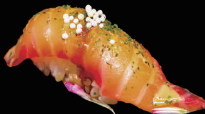
312 - N. SALMON ROSE allergeni: 1, 4, 6