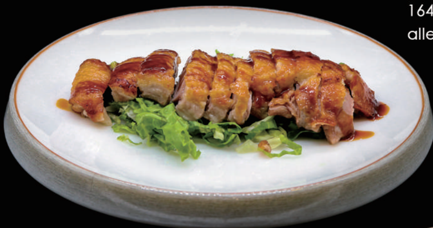
165 - ANATRA ARROSTITO