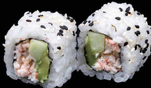
504 - URA. CALIFORNIA allergeni: 1, 2, 3