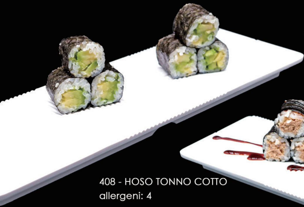
407 - HOSO AVOCADO