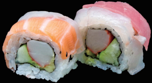
514 - URA. RAINBOW allergeni: 4