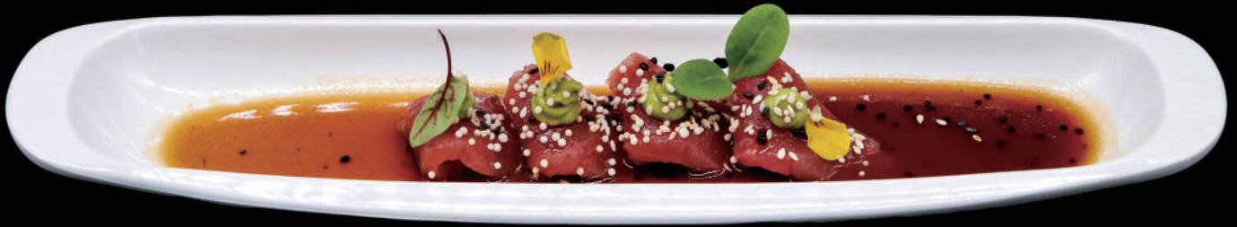
055 - CEVICHE TUNA allergeni: 1, 4, 6, 11