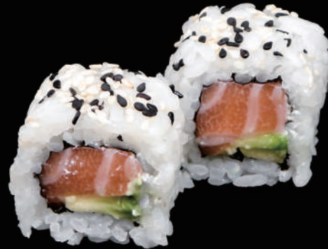
502 - URA. PHILADELPHIA allergeni: 4, 7, 11