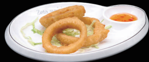
006 - ANELLI DI CIPOLLA allergeni: 1