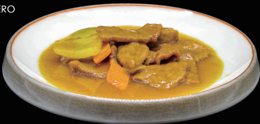
164 - MANZO AL CURRY allergeni: 2