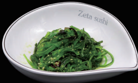
015 - GOMAWAKAME