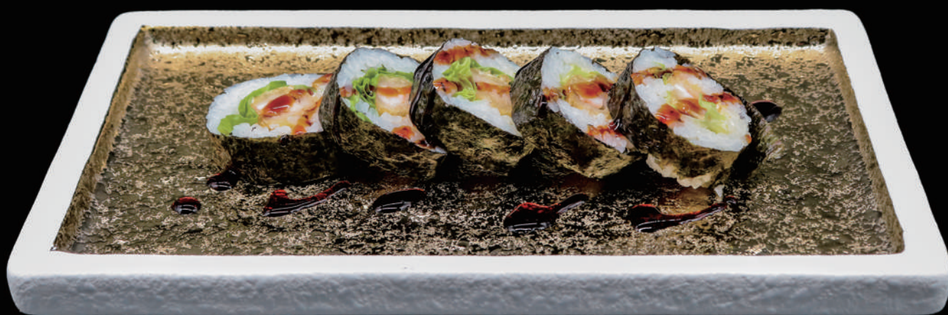
473 - FUTO EBITEN allergeni: 4