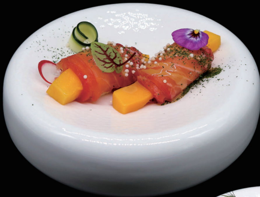
109 - AFFUMICATO ROLL