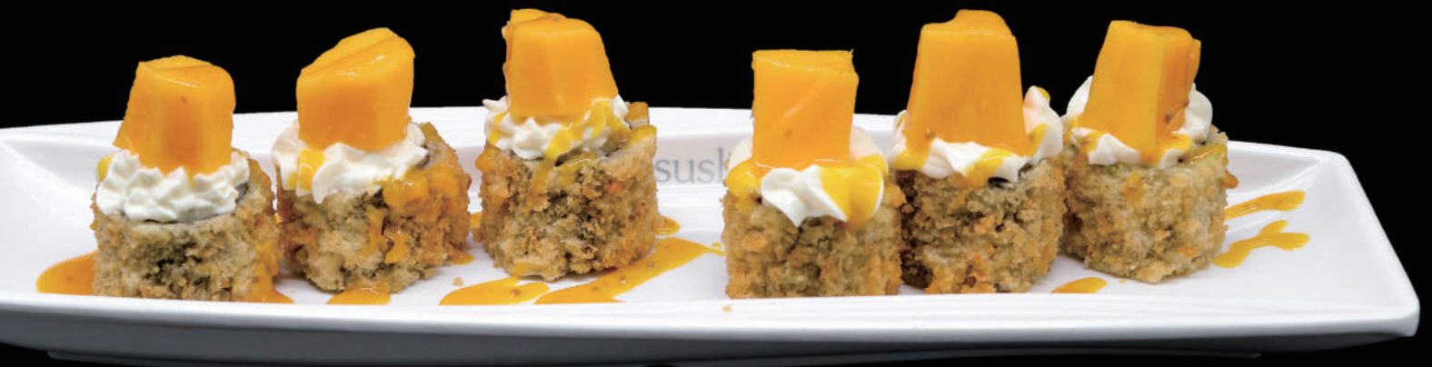
415 - FLY HOSO MANGO allergeni: 1, 6, 10