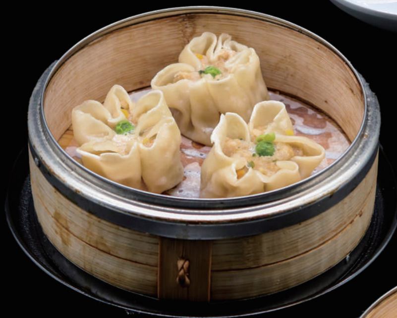
020 - SHAOMAI