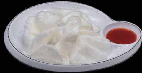
010 - NUVOLE DI DRAGO