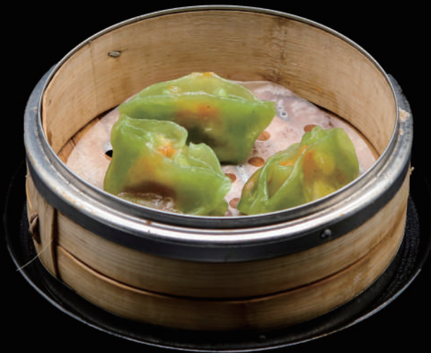
024 - DIM SUN VERDURE