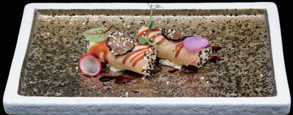
113 - CANNOLO MAGURO allergeni: 1, 4, 6, 7