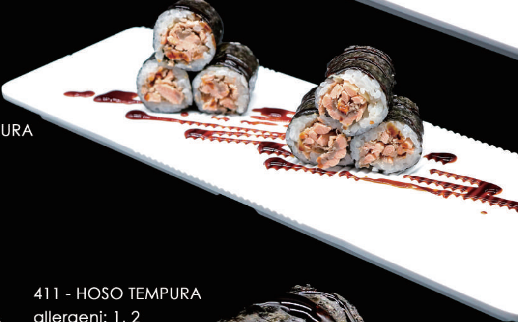
410 - HOSO MIURA allergeni: 4