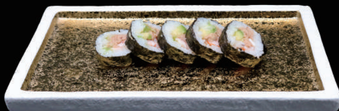
471 - FUTO PACIFIC allergeni: 4