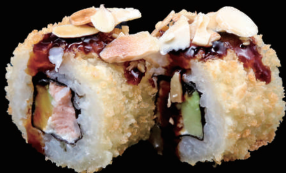
509 - URA. FRY PHILA allergeni: 1