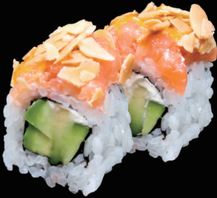
524 - URA. MANDORLE allergeni: 1, 4, 7