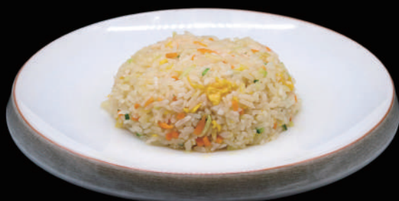
127 - RISO VERDURE