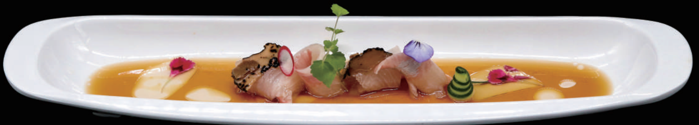
058 - CARPACCIO KANPACHI allergeni: 4, 6