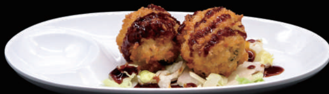
180 - SALMON KAROKKE allergeni: 1