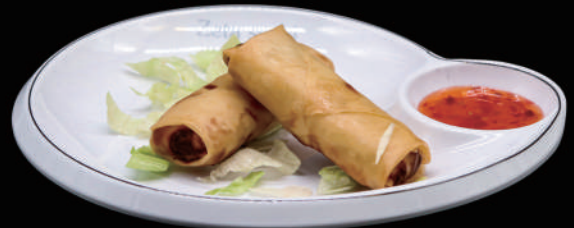
002 - INVOLTINO PRIMAVERA allergeni: 1