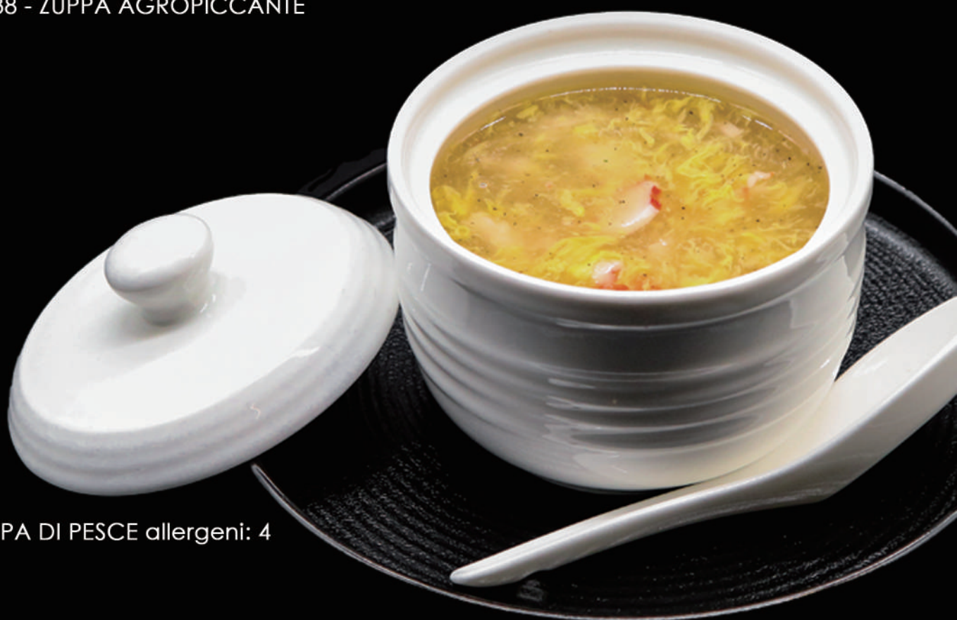
039 - ZUPPA DI PESCE allergeni: 4