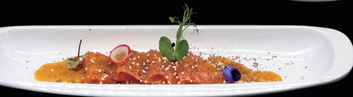
052 - SALMON CHOCOLATE allergeni: 4, 6, 10