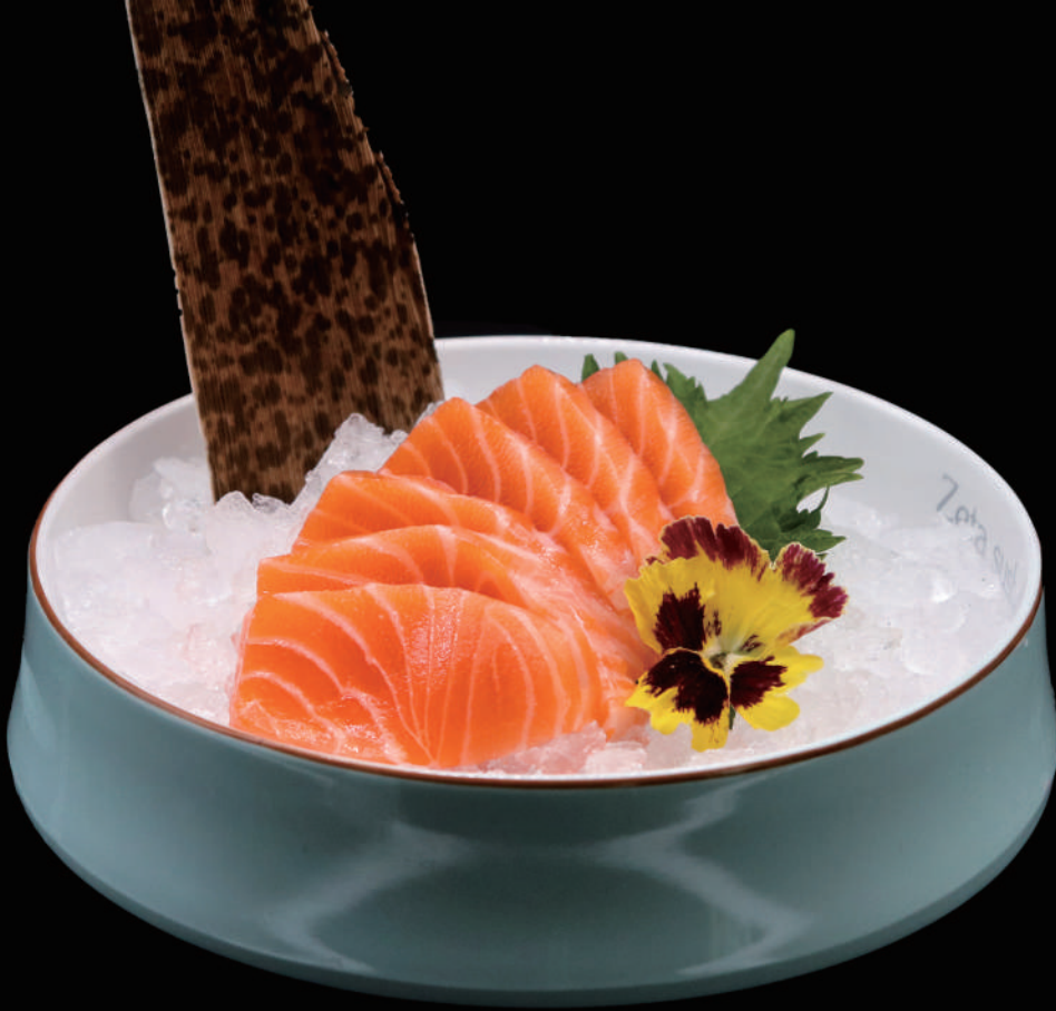
251 - SASHIMI SAKE allergeni: 4